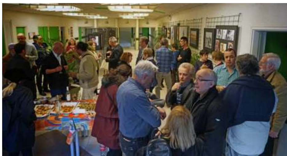
« Venise », Collège Jules VALERI, Nice, mars 2015