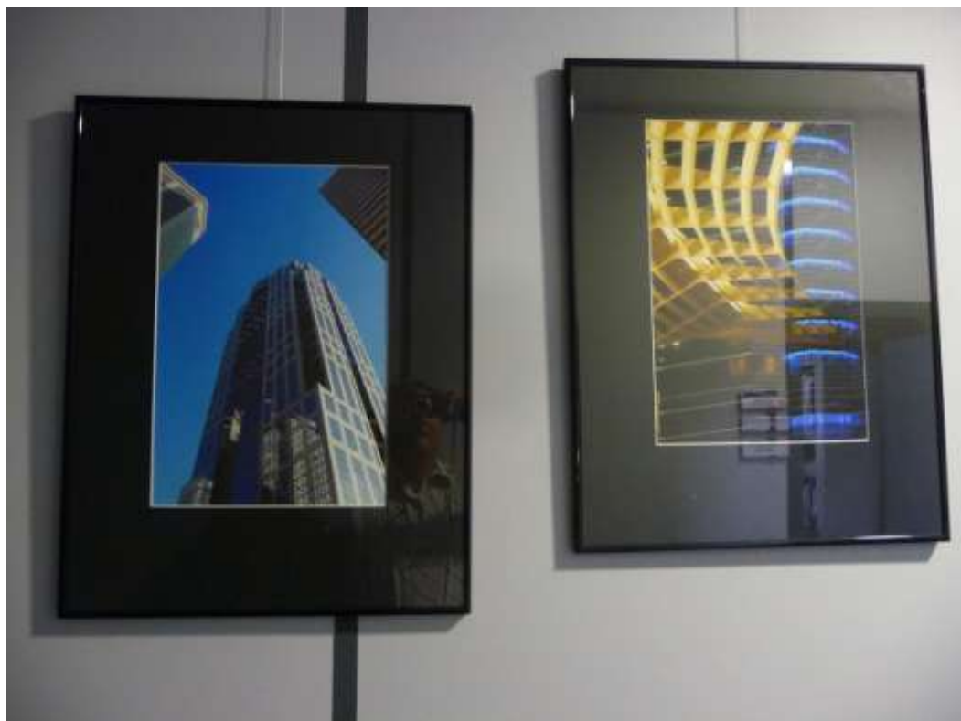
« Urban », DOTC, Nice, avril 2015