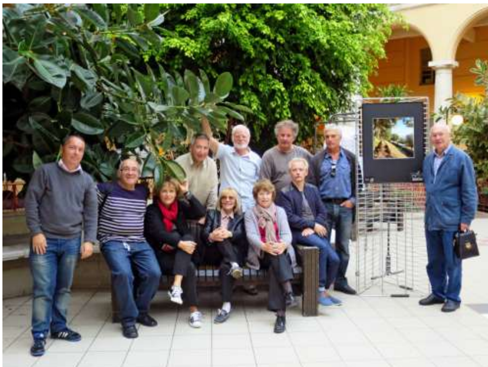
« Parenthèse Verte », CHU St Roch, octobre 2014