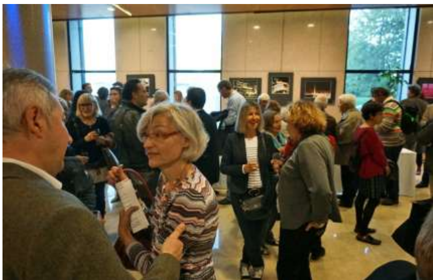
« NISSA », BPCA, Nice, avril 2015