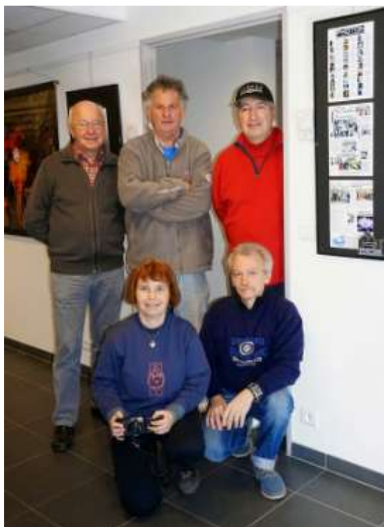
« Venise », Maison du Département de Roquebillière, mars 2015