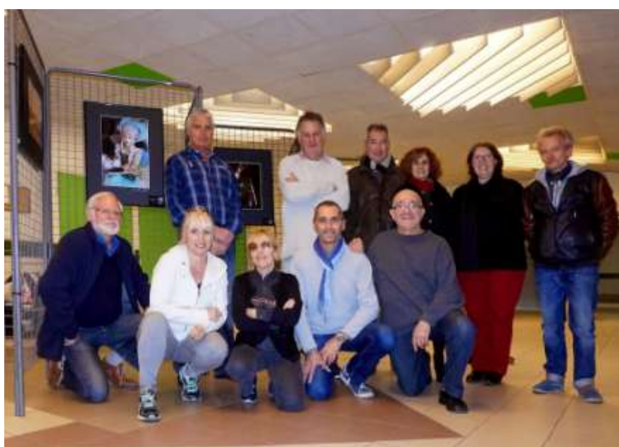
« Venise », Collège Jules VALERI, Nice, mars 2015