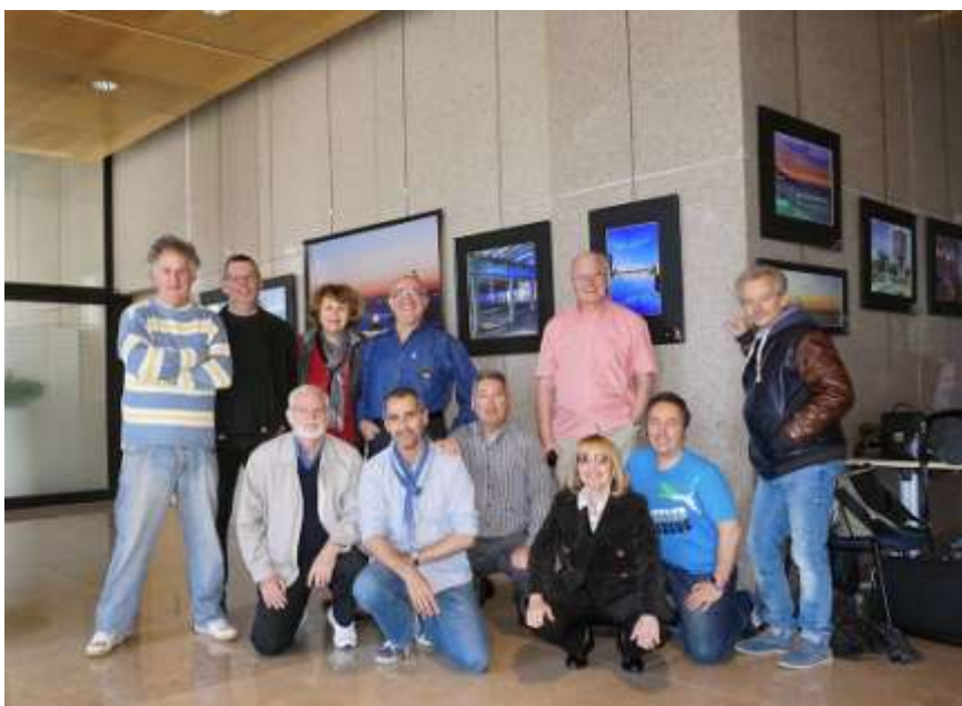
« NISSA », BPCA, Nice, avril 2015