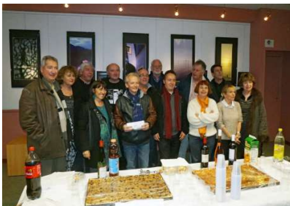
« Musigraphie », Espace Magnan, Nice, janvier 2015