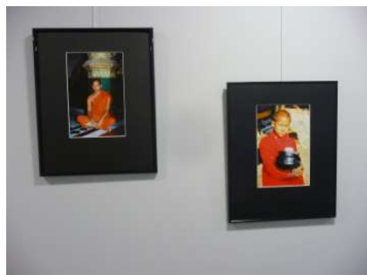
« Lumière de Bouddha », DOTC, Nice, avril 2015