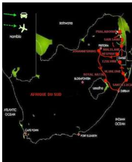
« Afrique du Sud », Cabinet de radiologie, Nice, janvier 2015