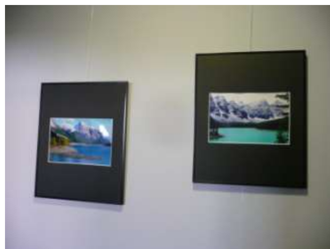
« OUEST CANADIEN », DOTC, Nice, 2014