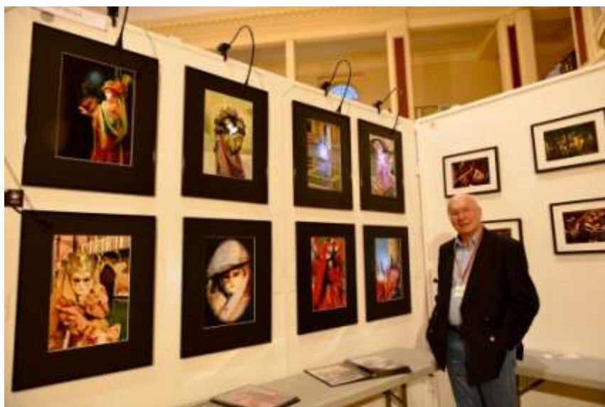
« Urban », PHOTOMENTON, novembre 2014