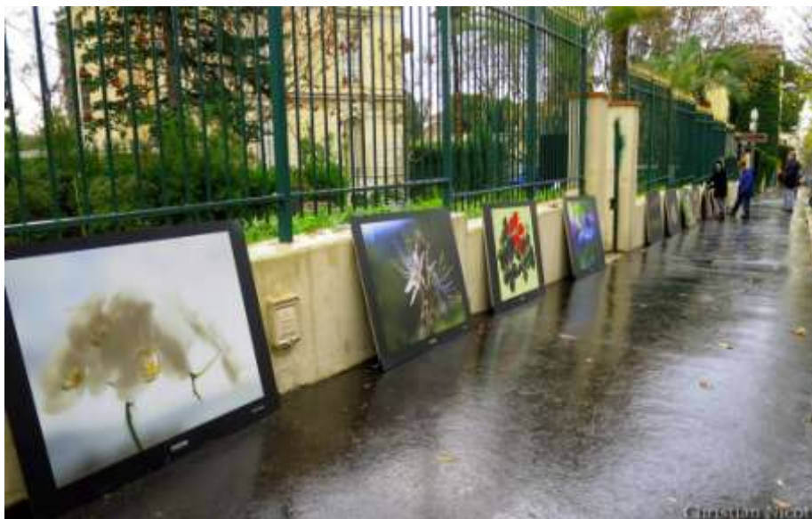
« Dites le avec des fleurs », Jardin Gorbella, Nice, décembre 2014