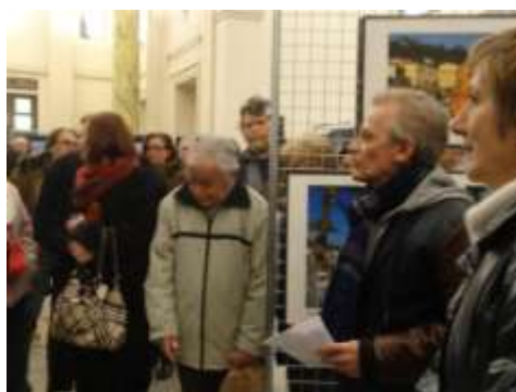
« NISSA », Bibliothèque Raoul Mille, Nice, décembre 2014