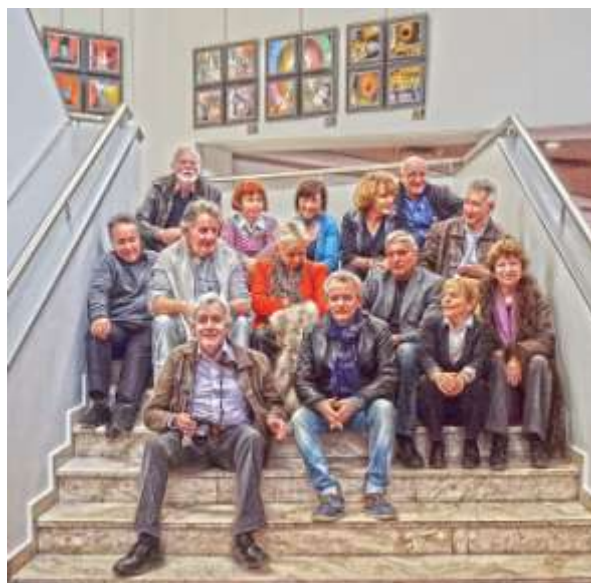
« 4x4 », Hôtel Novotel, Cannes, janvier 2015