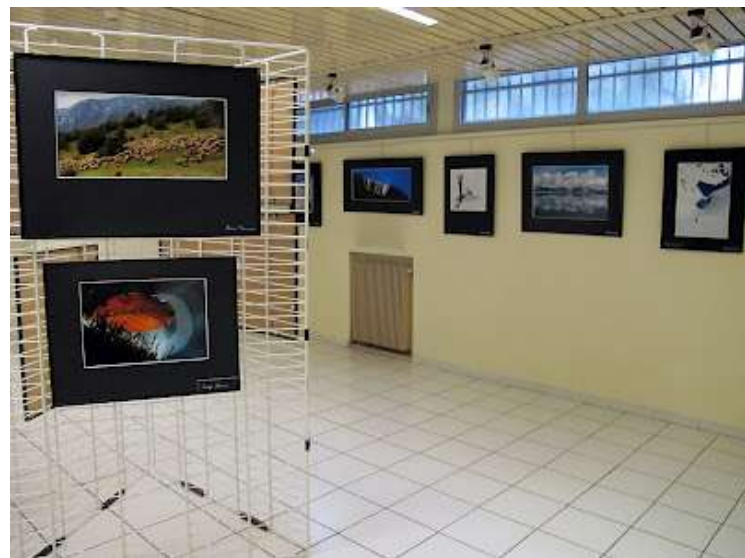
"Mercantour", Forum Nice Nord, février 2012