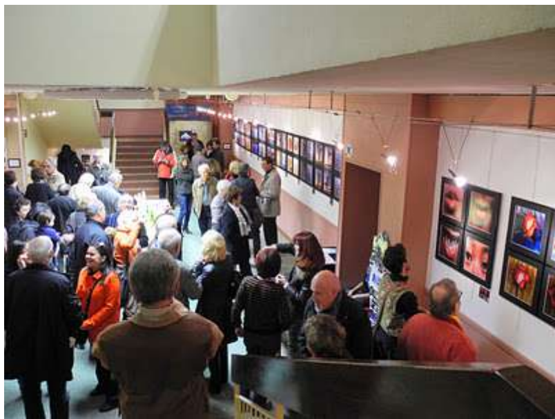
"4x4", Espace Magnan, Nice, février 2012