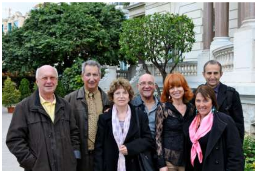
« 3èmes Trophées de l'Environnement », remise du prix, avril 2012