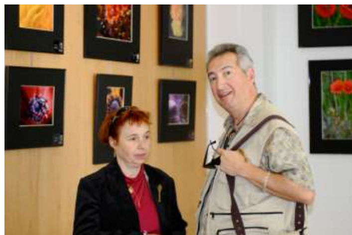
Semaine du développement durable, exposition « Fleurs », avril 2012