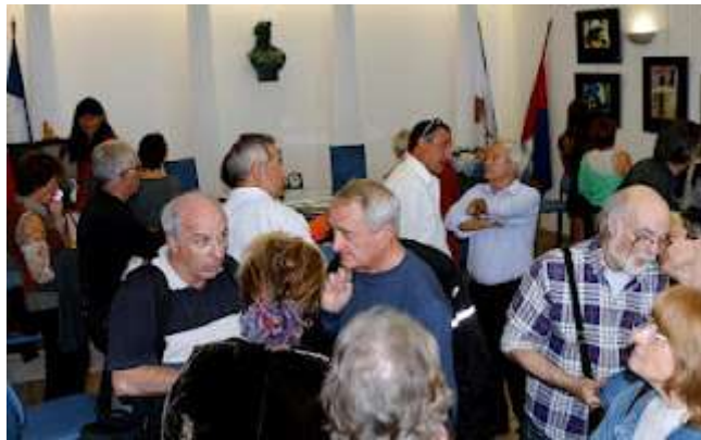
"Portrait et Reflets", Mairie annexe du Cros de Cagnes, mai 2012