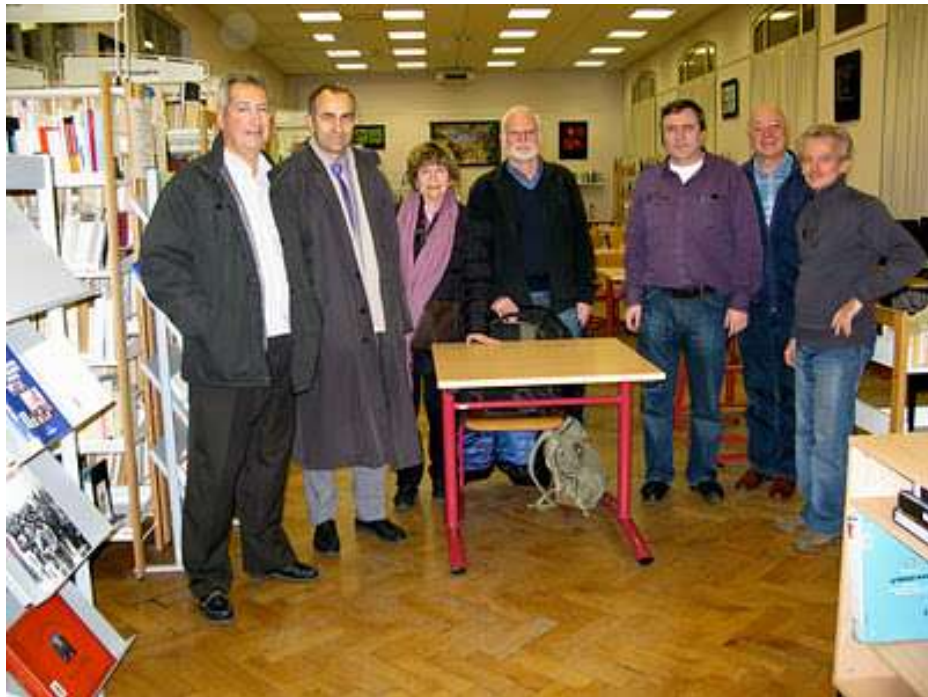
"Calligraphie Végétale", C.D.I. du Lycée Masséna, janvier 2012