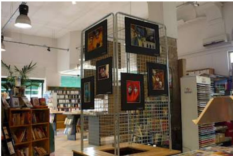
Librairie du Quartier Latin à Nice, « Carnaval de Venise », mars 2012