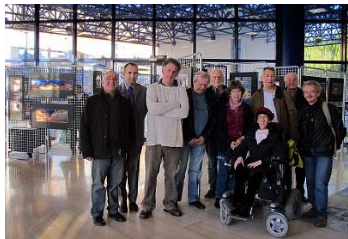
« Nice, Regards Croisés », Gare des Chemins de Fer de Provence. Nice, janvier 2012