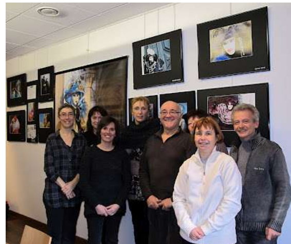
Venise et son carnaval, Saint Martin Vésubie, mars 2012