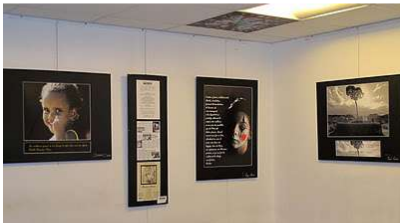
Exposition "Murmure d'Image", urgences de la clinique du Parc Impérial, janvier 2012