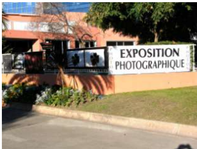
«Végétal Émoi», Parc Phœnix, janvier 2012